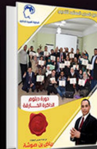
المادة العلمية سيناريو الدورة