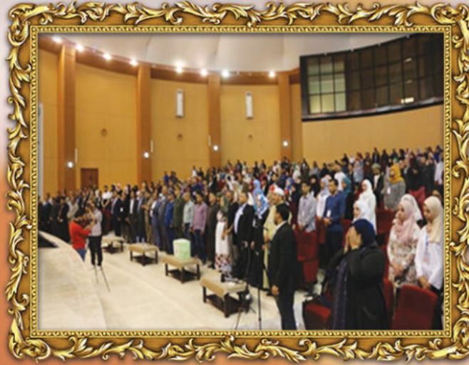
حفل افتتاح بطولة الذاكرة للجامعات