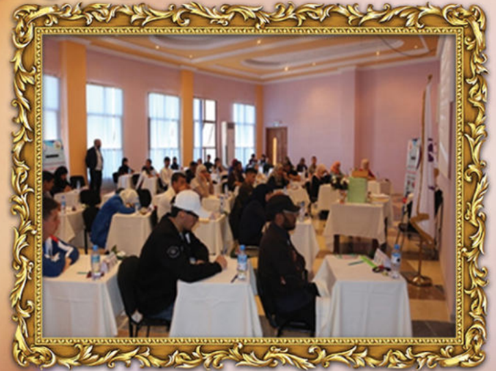
قاعة منافسات بطولة الذاكرة للجامعات